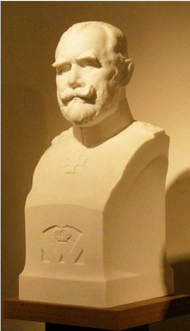
König Wilhelm II. von Württemberg. Büste in der Grabkapelle auf dem Rotenberg