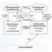
Die "neue" Landeskirche nach der Verfassung von 1924 Urheber: Joachim Botzenhardt. Aus: Gott und Welt in Württemberg, Stuttgart 2000, S. 170. Mit freundlicher Genehmigung.