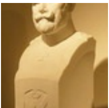
König Wilhelm II. von Württemberg. Büste in der Grabkapelle auf dem Rotenberg