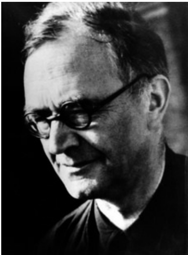
Karl Barth (1886-1968)