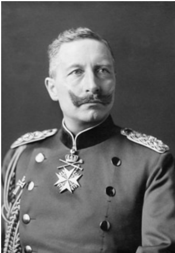
Kaiser Wilhelm II. von Preußen, Fotografie 1902