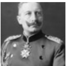
Kaiser Wilhelm II. von Preußen, Fotografie 1902