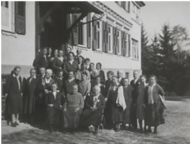
Teilnehmerinnen der Vertrauensleutefreizeit des Evangelischen Volksbundes für Württemberg in Freudenstadt 1931