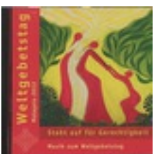
Musik-CD 2012 (Malaysia), LKAS, Abb_8_K17 Musik-CD 2012 (Malaysia), LKAS, Abb_8_K17