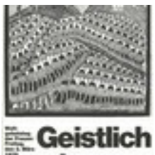
Plakat 1979 (Ostafrika), LKAS, K17_Nr.189 Plakat 1979 (Ostafrika), LKAS, K17_Nr.189