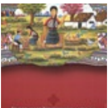
Plakat 1993 (Guatemala), LKAS, K17_Nr.201 Plakat 1993 (Guatemala), LKAS, K17_Nr.201