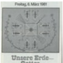
Die Weltgebetstagsliturgie von 1981 Die Weltgebetstagsliturgie von 1981