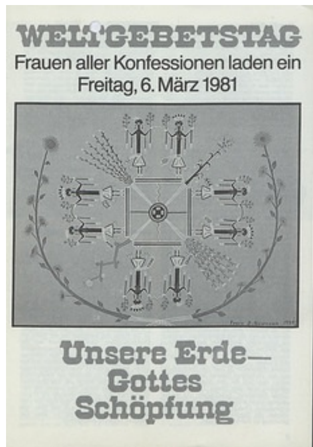
Die Weltgebetstagsliturgie von 1981

Die Pole dieses Disputes waren die Frage nach dem rechten Glauben einerseits und der Bereitschaft zu Weite und Akzeptanz religiöser Interkulturalität andererseits. Der theologische Richtungsstreit wurde schließlich rechtlich im Deutschen Weltgebetstagskomitee geregelt. Die dort herausgegebenen Liturgien sind mittlerweile unveränderlich und unterliegen einem Copyright.