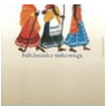
Plakat 1991 (Kenia), LKAS, K17_Nr.199 Plakat 1991 (Kenia), LKAS, K17_Nr.199