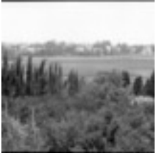
Deutsche Kolonie Sarona mit Felder, 1930

Fotograf: Paul Hommel. Landeskirchliches Archiv Stuttgart, Bildersammlung, Nr. 2578