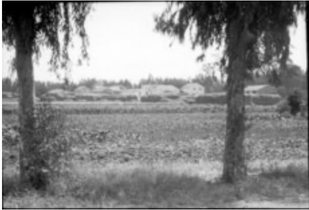
Ansicht der deutschen Kolonie Wilhelma, 1930

dort 1902 die neue Landwirtschaftskolonie (heute Bnej Atarot) zu gründen. Ein Teil der Templer aus Jaffa und auch aus Sarona siedelte in die Neugründung über, deren ursprünglicher Name – Hamidije-Wilhelma – den Dank der Kolonisten für die drei Personen zum Ausdruck bringen sollte, ohne deren Unterstützung die vierte Tempplersiedlung im Heiligen Land nicht denkbar gewesen wäre – des türkischen Sultans Abdul Hamid II., des württembergischen Königs Wilhelm und insbesondere des deutschen Kaisers Wilhelm II., des Protektors der deutschen evangelischen Christen im Heiligen Land und ihres eifrigsten Fürsprechers bei der Hohen Pforte.