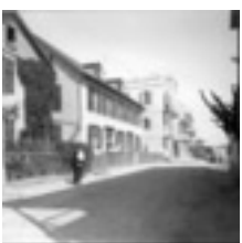
Blick auf die Seestraße in der deutschen Kolonie in Jaffa, 1929