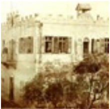
Gemeindehaus in Haifa, gegründet 1869