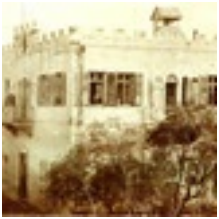
Gemeindehaus in Haifa, gegründet 1869