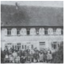
Gemeindesaal der Jerusalemfreunde auf dem Kirschenhardthof bei Erbstetten im Jahr 1866