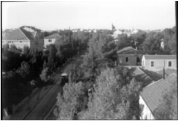
Hauptstraße der deutschen Kolonie in Jerusalem, 1929

Fotograf: Paul Hommel. Landeskirchliches Archiv Stuttgart, Bildersammlung, Nr. 2348