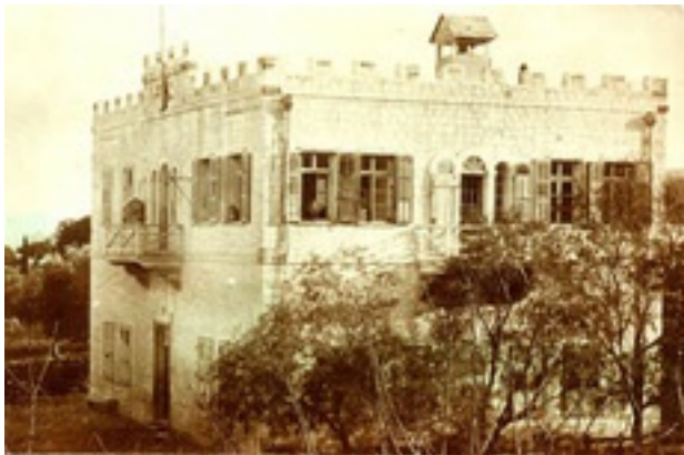
Gemeindehaus in Haifa, gegründet 1869