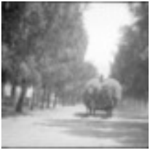
Eukalyptusbäume an der Hauptstraße der deutschen Kolonie in Wilhelma. Ein Strohwagen. 1930