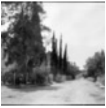
Nebenstraße in der deutschen Kolonie Sarona