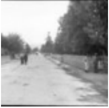
Blick auf die Dorfstraße (Kolonie-Straße) von Bethlehem-Galiläa, 1929