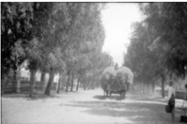
Eukalyptusbäume an der Hauptstraße der deutschen Kolonie in Wilhelma. Ein Strohwagen. 1930

Fotograf: Paul Hommel. Landeskirchliches Archiv Stuttgart, Bildersammlung, Nr. 2123