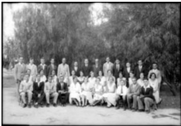
Schüler und Lehrer des deutschen Gymnasiums der deutschen Kolonie in Jerusalem, 1929