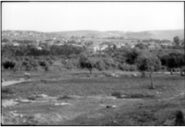
Blick vom Aussätzigen-Asyl auf die deutsche Kolonie in Jerusalem in der Rephaim-Ebene, 1930