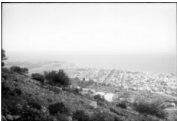
Blick vom Karmelberg auf die Stadt Haifa, die

Die erste der Tempelersiedlungen im Heiligen Land entstand auf Anraten des Konsuls des Norddeutschen Bundes in Haifa. Als Hoffmann und Hardegg am 30. Oktober 1868 in Haifa eintrafen, beschlossen sie, den Ort als Vorposten und Empfangsstation für künftige Einwanderer einzurichten. Aus den misslungenen Siedlungsversuchen der Kirschenhardthof-Zöglinge in der Jesreel-Ebene sowie einer amerikanischen Kolonie in Jaffa zog Hoffmann den Schluss, strengste Auswahlkriterien an die zukünftigen Auswanderungswilligen zu legen.