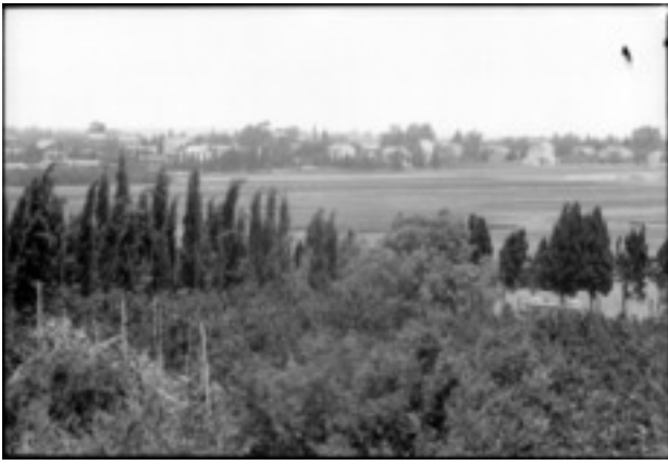
Deutsche Kolonie Sarona mit Felder, 1930