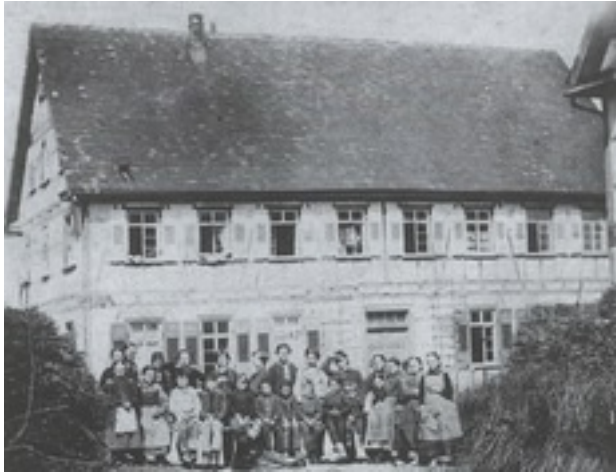
Gemeindesaal der Jerusalemsfreunde auf dem Kirschenhardthof bei Erbstetten im Jahr 1866