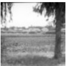
Ansicht der deutschen Kolonie Wilhelma, 1930

Nr. 2594