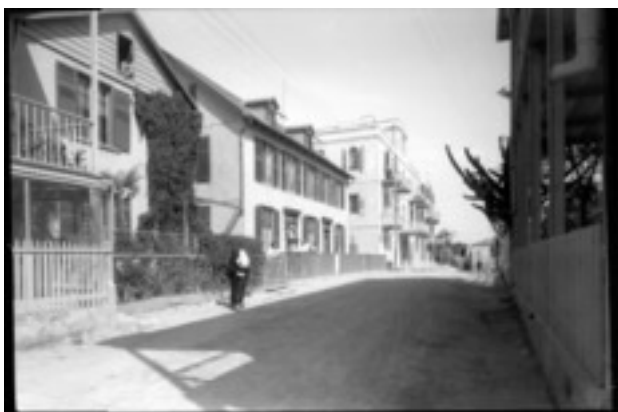
Blick auf die Seestraße in der deutschen Kolonie in Jaffa, 1929