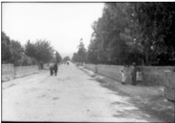
Blick auf die Dorfstraße (Kolonie-Straße) von Bethlehem-Galiläa, 1929