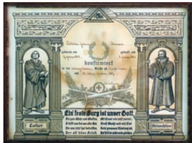
Erinnerungen an die Konfirmation 1917. Das 400. Jubiläum fiel ins Kriegsjahr 1917. Um die Jugend zu ertüchtigen, wurde Luther zum tatkräftigen deutschen Helden stilisiert– selbst auf Konfirmationsgedenkbältern. Auf sein Lied „Ein‘ feste Burg ist unser G

Beim vierten Reformationjubiläum stand man im vierten Jahr eines mörderischen Weltkriegs. Nach den Anstrengungen von 1916 mit dem erfolglosen deutschen Angriff auf Verdun und den Offensiven der Westalliierten an der Aisne und in der Champagne, die auch auf der deutschen Seite große Verluste gebracht hatten, war eine gewisse Ermüdung eingetreten. Doch der Kriegseintritt der USA 1917, der von Deutschland mit dem unbeschränkten U-Boot-Krieg beantwortet wurde, brachte eine Ausweitung des Krieges, die noch größere Anstrengungen erforderte. Es ist kein Wunder, daß man in dieser Lage einen Moment daran dachte, das Reformationsjubiläum zu verlegen, etwa auf 1921. Doch hielt man an 1917 fest. Schon früh, Ende 1916, erging eine Anweisung des Konsistoriums an die Pfarrämter, mit den Vorbereitungen für das Jubiläum trotz der Kriegszeit zu beginnen und im Unterricht und in der Christenlehre darauf hinzuweisen und den Gottesdiensten eine reichere liturgische Gestaltung zu geben.