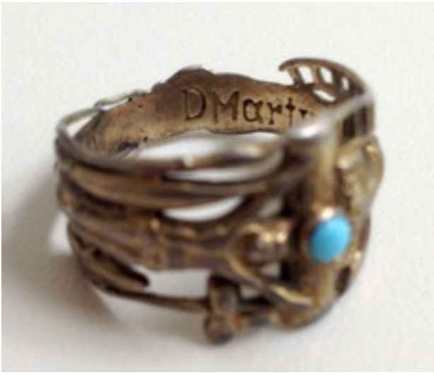
Nachbildung des Eherings der Katharina von Bora "Catharina v Boren - D. Martino Luthero", 1817 Zum Jubiläum 1817 wurden solche Ringe als Kopien hergestellt.

regiert wurde. Das geistige und konfessionelle Klima war vor allem durch die Aufklärung verändert, die territoriale Umgestaltung hatten Württemberg zu einem paritätischen Staat gemacht, in dem Evangelische und Katholiken gleiche Rechte besaßen. Das „Jahr ohne Sommer“ 1816 war ein Fehljahr gewesen, wobei der nahezu vollständige Ausfall der Ernte in dem immer noch agrarisch bestimmten Württemberg, das ohnehin durch die zurückliegenden napoleonischen Kriege geschwächt war, zu einer Hungersnot führte, unter der besonders die ärmeren Schichten zu leiden hatten.