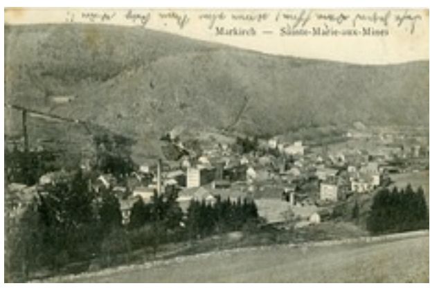
Layer Gottlob Markirch Sainte-Marie-aux-Mines