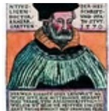
Johannes Brenz in Schaub und Chorrock Kolorierter Kupferstich, um 1568