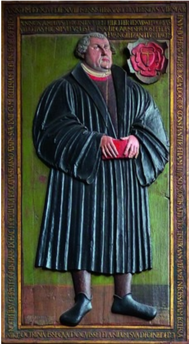
Martin Luther in der Schaube

Für den Reformator war bekanntlich die Verkündigung des Evangeliums wichtiger als die Kleiderordnung. (4) Luther selbst trug den bürgerlichen Rock, die sogenannte Schaube, auch auf der Kanzel. Dieser weite schwarze Übermantel mit Kragen reichte bis über die Knie. (Deshalb trugen die Altvorderen auch ihren Talar in dieser Länge, bzw. Kürze.) Daraus entwickelte sich eine schmäler geschnittene Variante, die bis zum namengebenden Knöchel (lat.: talus) reichte und zum Talar der Professoren wurde. Die evangelische Amtstracht war also eigentlich kein liturgisches Kleid, sondern ein Lehrgewand und wies die Pfarrer als „Lehrer“ des Evangeliums aus. Zur Feier der Sakramente jedoch scheute sich Luther nicht, die altkirchlichen Messgewänder zu tragen, wobei er im Sinne seines neuen Amtsverständnisses nicht mehr die Stola anlegte, die den Stand des geweihten Priesters auszeichnete, wohl aber die festliche Kasel, den Überwurf über das Untergewand. Der württembergische Reformator Johannes Brenz war dagegen für eine deutliche Unterscheidung: