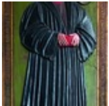
Martin Luther in der Schaub St. Andreas-Kirche in Erfurt