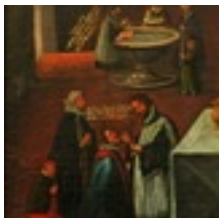
Konfessionsbild Ulm-Jungingen, 1711