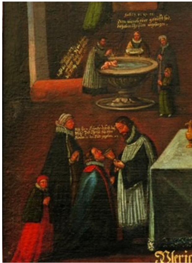
Konfessionsbild Ulm-Jungingen, 1711