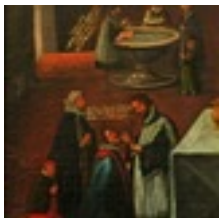
Konfessionsbild Ulm-Jungingen, 1711