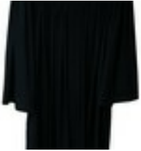
Württembergischer Talar mit Überschlags-Beffchen Privatbesitz