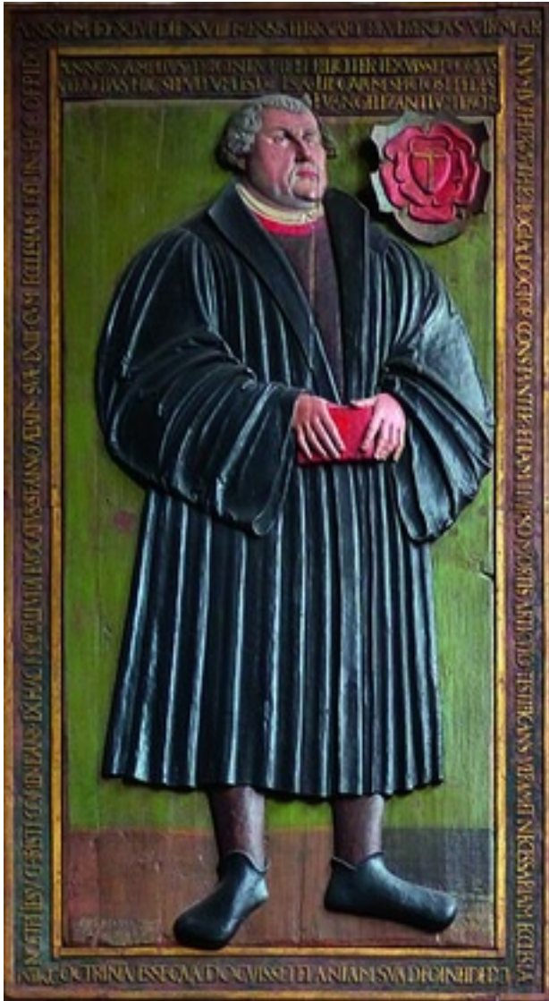
Martin Luther in der Schaube

Für den Reformator war bekanntlich die Verkündigung des Evangeliums wichtiger als die Kleiderordnung. (4) Luther selbst trug den bürgerlichen Rock, die sogenannte Schaube, auch auf der Kanzel. Dieser weite schwarze Übermantel mit Kragen reichte bis über die Knie. (Deshalb trugen die Altvorderen auch ihren Talar in dieser Länge, bzw. Kürze.) Daraus entwickelte sich eine schmäler geschnittene Variante, die bis zum namengebenden Knöchel (lat.: talus) reichte und zum Talar der Professoren wurde. Die evangelische Amtstracht war also eigentlich kein liturgisches Kleid, sondern ein Lehrgewand und wies die Pfarrer als „Lehrer“ des Evangeliums aus. Zur Feier der Sakramente jedoch scheute sich Luther nicht, die altkirchlichen Messgewänder zu tragen, wobei er im Sinne seines neuen Amtsverständnisses nicht mehr die Stola anlegte, die den Stand des geweihten Priesters auszeichnete, wohl aber die festliche Kasel, den Überwurf über das Untergewand. Der württembergische Reformator Johannes Brenz war dagegen für eine deutliche Unterscheidung: