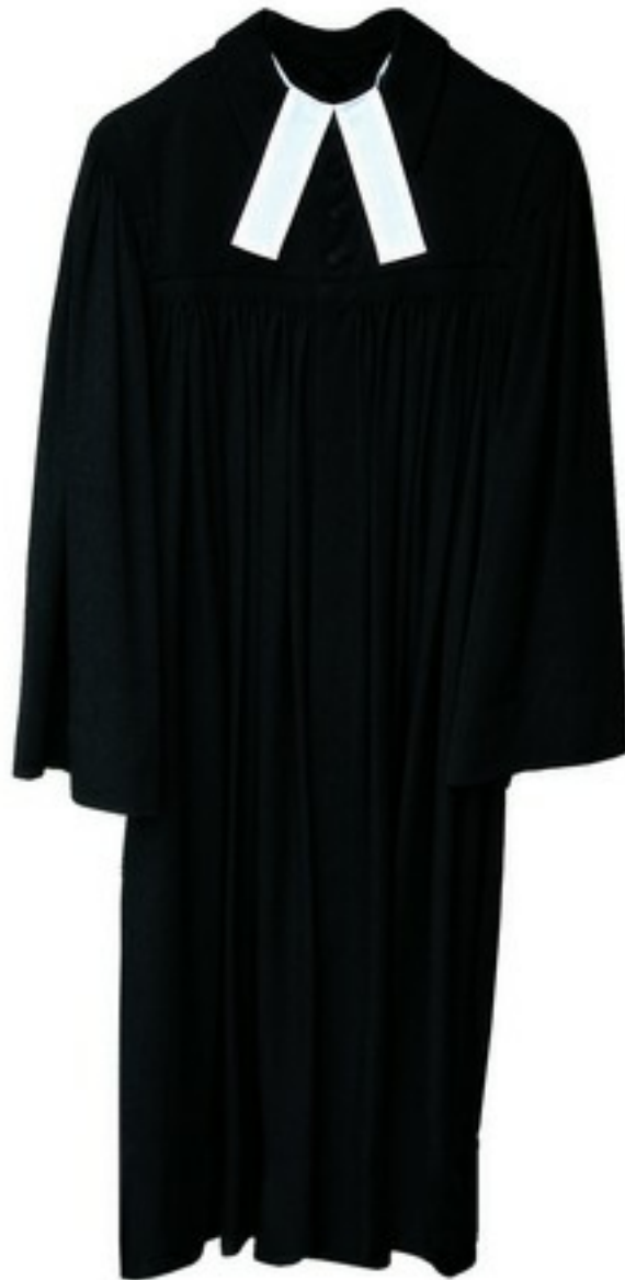
Württembergischer Talar mit Überschlags-Beffchen

Der Talar hat somit die Funktion, die individuelle Person zu überkleiden und damit den liturgischen Dienst für die Gemeinde und die Einheitlichkeit des kirchlichen Amtes zu betonen. Aber die für viele Betrachtenden geradezu verwirrende evangelische Vielfalt und Provinzialität zeigt sich auch und gerade in der Geschichte der Amtstrachten der einzelnen Landeskirchen und Territorien, zuweilen gar von Stadt zu Stadt, von Dorf zu Dorf unterschiedlich geprägt. Deshalb konzentriert sich diese Darstellung auf Württemberg und seine Besonderheiten, wobei die Altwürttemberger beinahe schon klischeehaft als liturgische Kaltblütler dargestellt werden. Das mag auch damit zusammen hängen, dass sie zwar mit der Reformation die lutherische Lehre in ihren Grundsätzen übernommen und weiterentwickelt haben, nicht aber die an der Messe orientierte lutherische Liturgie, sondern bei der schlichten Form des Predigtgottesdienstes geblieben sind. Christoph von Kolb, Prälat und letzter württembergischer Hofprediger, summiert es in seinem Standardwerk zum württembergischen Gottesdienst so: