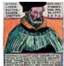
Johannes Brenz in Schaub und Chorrock Kolorierter Kupferstich, um 1568