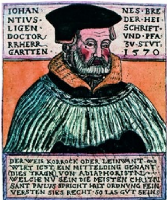
Johannes Brenz in Schauben und Chorrock