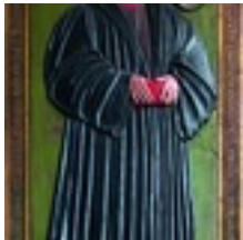
Martin Luther in der Schaub St. Andreas-Kirche in Erfurt